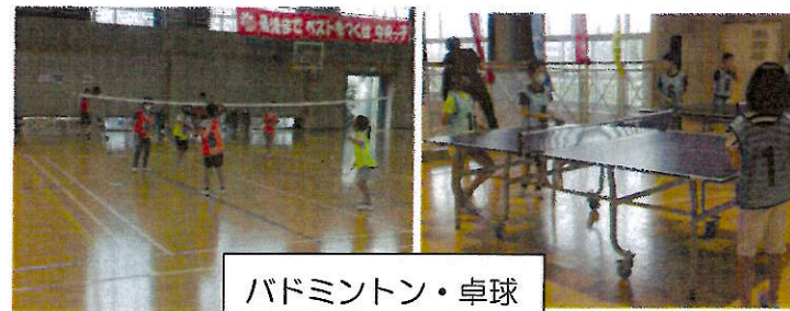
バドミントン・卓球